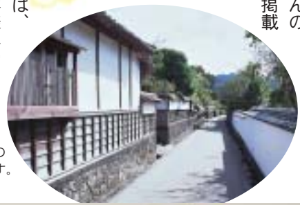
夏みかんの香りは、情緒漂う萩の城下町を思いおこさせてくれます。

県内で販売されている夏みかんのお菓子などを集めてみました。掲載しきれないほど、まだまだいろいろな種類がありますが、どれも夏みかんのさわやかさが生かされたおいしいものばかり。みなさんはこの中でいくつ食べた事がありますか?