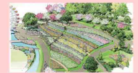
●フラワーガーデン