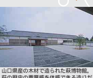
山口県産の木材で造られた萩博物館。萩の歴史の重厚感を体感できる造りだ。

昨年開館した萩まじゅう博物館の中にあるカフェで、訪れる人々にくつきぎの空間を提供している。メニューには出来る限り萩産の食材を使用し、カフェとは思えないほど本格的。萩の農水産物の味を多くの人に知ってもらおうと、見蘭牛の、見蘭ローティーフ丼(950円)や、見角和牛ハヤシライス(650円)、新鮮な魚介が小丼にのった萩三旬餅(950円)が人気。