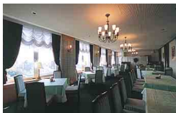
「ベルヴェデーレ」は見晴しが良いところという意味で、食事をしながら周南市を一望できる。

周南総合庁舎の7階という眺望の良い場所にあるレストラン、ベルヴェデーレでは、モーニングからディナーまで、それぞれの時間帯に合わせた料理が楽しめる。フランス料理、ギャルソンの姉