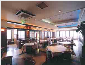
昼は海峡を通る船、夜は開門海峡と門司港のネオンを眺めながら食事を楽しめる。

雄大に広がる開門海峡を簡潔に望む、敦煌下関店。ここでは、地産地消の本格的な中華料理が味わえる。昼のランチ、ハイキングや季節ごとに一新されるコース料理もあり、メニューは100種類を