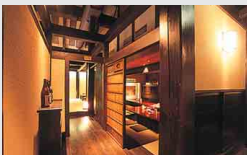
いろいろなタイプの席があり、目的・用途に合わせた食事が出る。

その食材が一番おいしい状態で食べられるように、こだわりの和食を提案する、櫻庵。自分で焼ける備長炭を使った陶板・七厘炙り焼きが人気で、地産地消料理は試作に試作を重ねた、四季校御